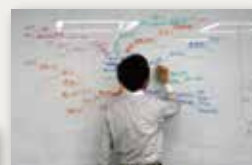
ホワイトボード上にアイデアを見る化